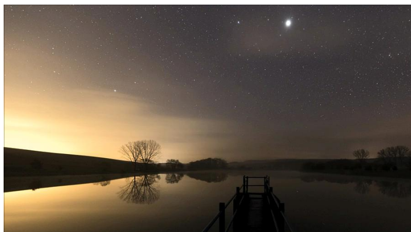
2. miesto: Peter Šároši